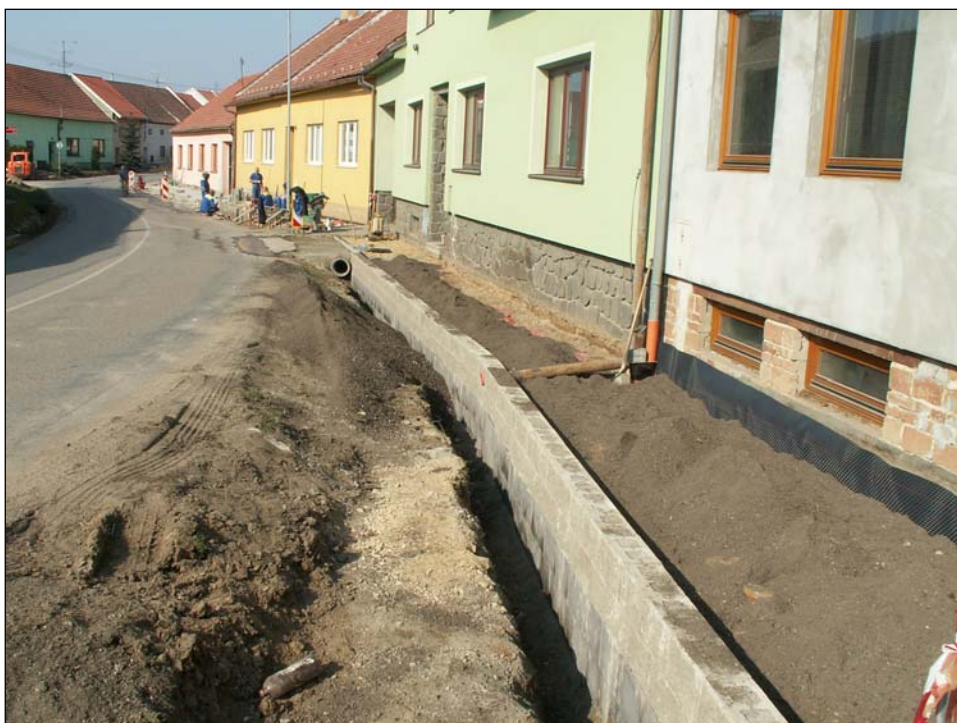
Oprava chodníku na ulici Pavlíkova